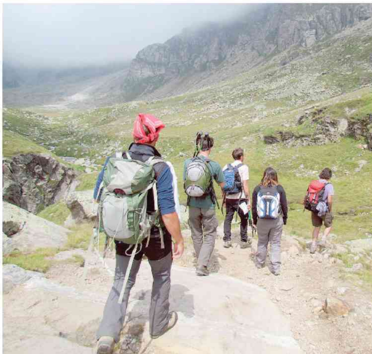
Campi estivi sui sentieri del Parco nazionale del Gran Paradiso